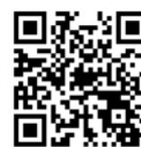
(川崎市病院局のホームページ)